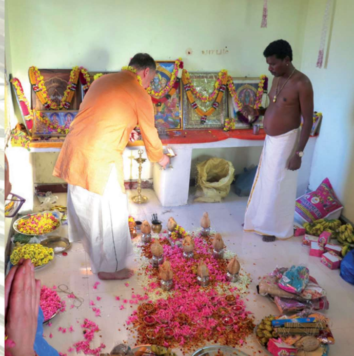
Po čtení palmového listu následuje obřad